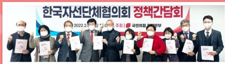
제20대 대선후보캠프에 제안하는 비영리섹터 발전과 기부문화 활성화를 위한 정책 제안